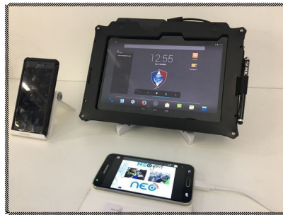
Modèles de tablette et de téléphone NEO que les flics utilisent.

(!) Le fait de donner une fausse adresse entraîne simplement la non-réception de l'avis d'AFD et n'empêche pas sa validité, voire même augmente les risques de l'avoir majorée... D'ailleurs les flics se fichent souvent de bien noter ton adresse et ont tendance à eux-mêmes faire des erreurs.